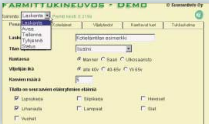
FarmiTukineuvos on Internet Explorer 4:ssä tai sitä uudemmissa versioissa toimiva sovellus. Laskelma on mahdollista tallentaa, jolloin sen voidaan ottaa helposti uudelleen tarkasteluun.